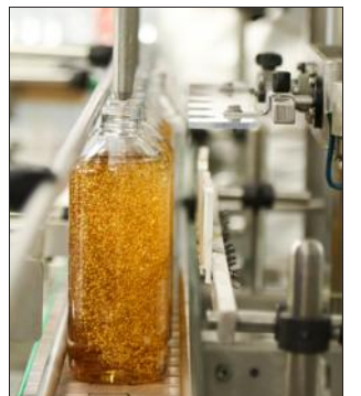
Proveni est le leader français du savon de Marseille liquide.

Entreprise chablaisienne historique, le laboratoire Proveni, fabricant de savon situé à Bons-en-Chablais, a vu son chiffre d'affaires passer la barre des 20 millions d'euros en 2020. La société de 70 salariés, spécialiste de la formulation et de la production de savon liquide par saponification à chaud et d'hygiène liquide à partir de la transformation de matières premières naturelles, leader français du savon liquide de Marseille, a été portée par une demande en forte croissance dans le contexte de crise sanitaire liée à l'épidémie de Covid-19 depuis presque un an. Le chiffre d'affaires de l'entreprise a plus que doublé en cinq ans (il s'élevait à 8 millions d'euros en 2015). Pour faire face à cette croissance, Proveni construit actuellement un second site de production et de stockage, à côté de celui existant.